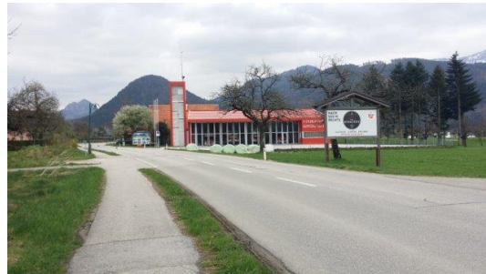
Feuerwehr ca. 150 m nach der Ortstafel