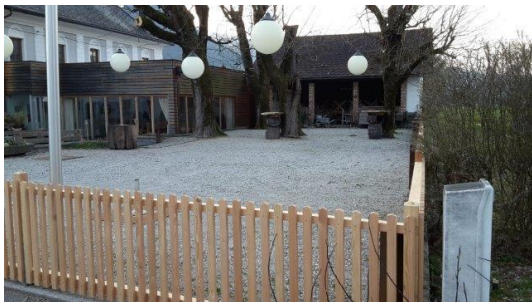
Garten und Salettl