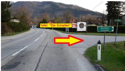
ca. 450 m nach der Feuerwehr rechts abbiegen